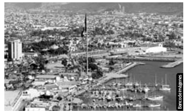
Oficialmente el Puerto fue abierto al comercio en 1877.

La emprendedora concluyó que gracias a Coparmex y PlanCrecer actualmente están en la legalidad, y saben el derecho y acceso que tienen a distintos créditos, además de tener la guía para poder hacer trámites burocráticos, teniendo como meta llegar a los cincuenta trabajadores.