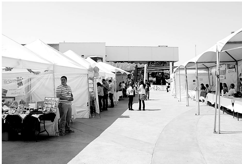
En la explanada del Cearte se desarrolló la exposición de la Jornada empresarial.

En este concurso participaron 19 proyectos, los cuales fueron evaluados en aspectos como: viabilidad financiera, innovación, impacto social, aplicabilidad en el corto plazo, manera